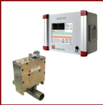
Schweißnahterkennung SND - 40 für Rohre und Profile