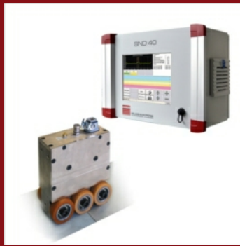
Schweißnahterkennung SND - 40 an Coil- und Flachmaterial