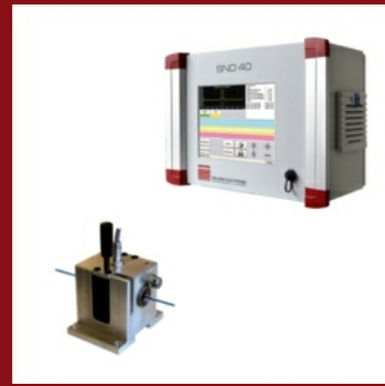
Schweißnahterkennung SND - 40 für Drähte, Seile (Stoßnaht)